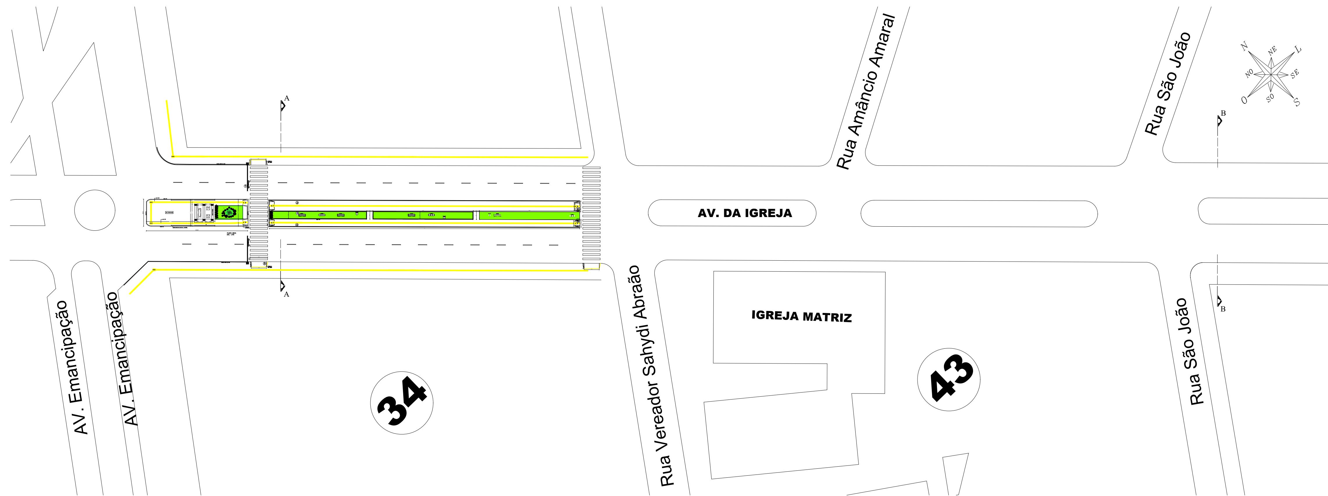
PLANTA BAIXA ESC: 1/500