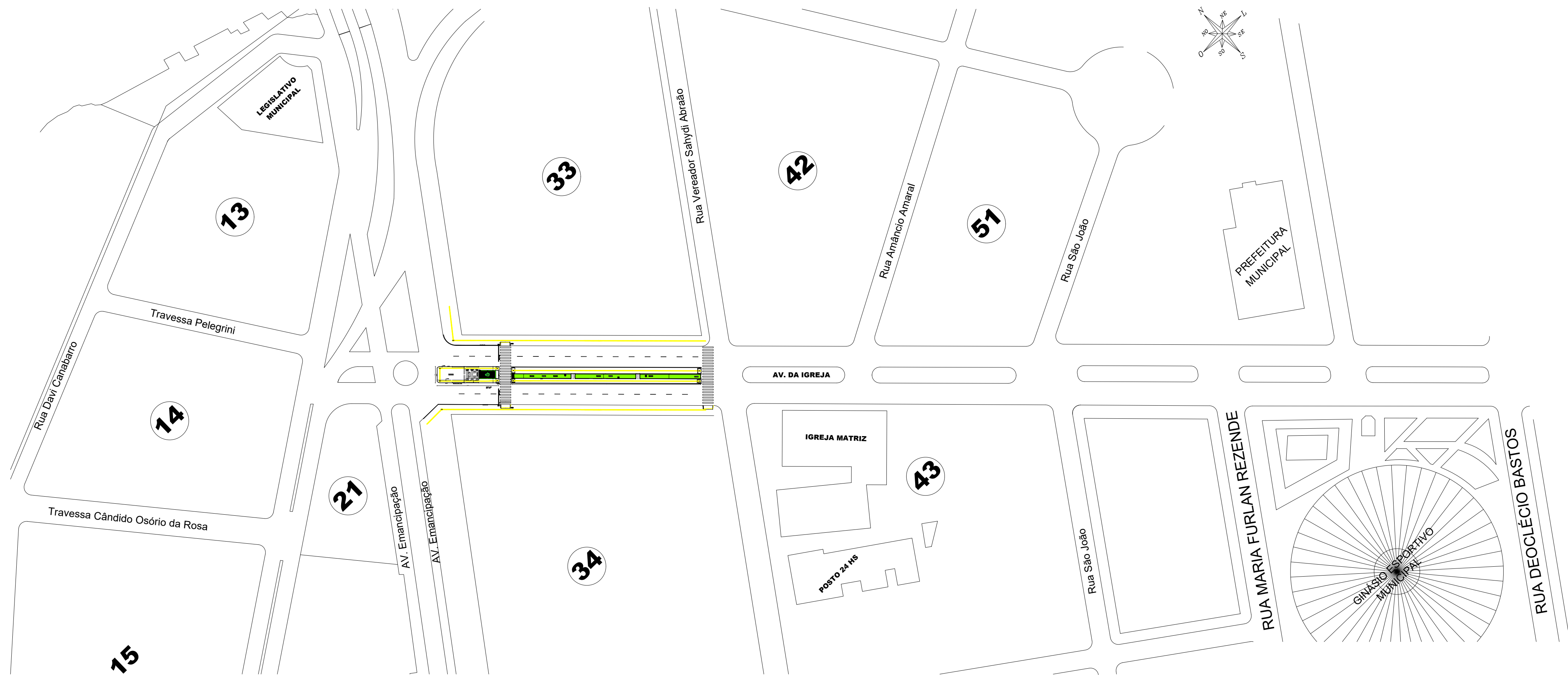
SIUAÇÃO ESC: 1/1000