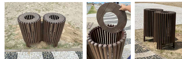
Lixeira Dupla - Modelo PMT